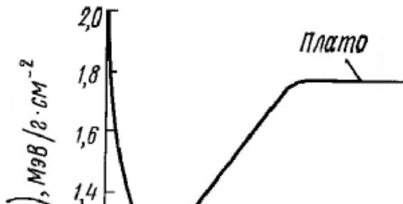
Рис. 1 Ионизационные потери мюонов

соответствующая ему передача энергии p^2/2m пропорциональна 1/v^2 .